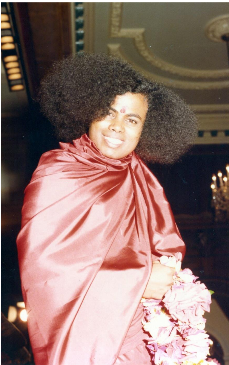
Swamiji 1983 in Grossbritannien

Die ganze Zeit haben wir jetzt Bhajans gesungen. Wir sind müde, schläfrig, unsere Körper schmerzen und einige von uns haben nicht einmal einen richtigen Stehplatz. Trotzdem dachte ich: „Worüber soll ich zu euch sprechen?“ Wir können immer vom Göttlichen reden, jederzeit, überall und in jeder Situation. Wenn wir das tun, wird die Müdigkeit bedeutungslos, denn wenn wir den Namen des allmächtigen Gottes loben und singen, können wir uns durch seine Gnade von Problemen, Schwierigkeiten und Krankheiten befreien. Es braucht keinen speziellen Zeitpunkt dazu; man kann jederzeit an Gott denken. Wenn wir an Gott denken und um seine Gnade bitten, während wir seinen Namen rezitieren oder singen, dann wird seine Gnade in unsere Herzen kommen und diese von Unreinheiten reinigen. So groß ist die reinigende Kraft Gottes! Ihr könnt den göttlichen Namen in jeglicher Form besingen und verehren – ihr könnt Muruga, Krishna, Shiva, Vinayaga oder Devi sagen... Welche Gestalt auch immer ihr zur Verehrung wählt, Gott ist in allen Formen als Shiva-Shakti präsent – er ist eins, mit einer Bedeutung.