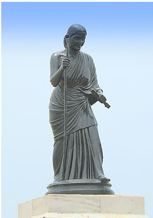
Eine Statue, welche die grosse Dichter-Heilige Avvaiyar ehrt.

Eine romantische Beziehung zum Beispiel, ist eine persönliche Angelegenheit zwischen einem Mann und einer Frau. Ihre reine und wahre Liebe wird ihre Herzen vereinen, und sie werden in Stille die unbeschreiblichen Gefühle, die aus ihrer Tiefe aufsteigen, wertschätzen. (Auf tamilisch nennt man diese Art von Liebe agaporul oder agathinai , eine selbstlose Liebe für eine Person, ohne sexuelle Verwicklungen.) In dieser Hinsicht sind Männer und Frauen gleich. Wenn sie in ihrer Beziehung Erfolg haben wollen, sollten sie sich gegenseitig ihre Verehrung zeigen und sich dem anderen anpassen. Sie sollten sich auf halbem Wege treffen, statt sich in Streitigkeiten zu verwickeln. Wenn die Rechte von beiden nicht geehrt werden, ist ihr Leben dazu verurteilt, seiner Süße beraubt zu werden.