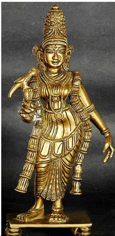
Eine Statue der Heiligen Andal

An diese großartigen Frauen, welche den Herrn mit ehrlicher Hingabe durch Gesang lobten, erinnert man sich in Tamil Nadu heute noch mit Hochachtung.