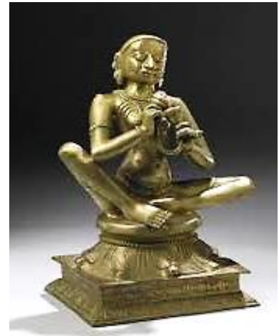
Eine Statue der Heiligen Karaikkal Ammaiyar

Ohne Deine göttliche Form zu erblicken, wurde ich – völlig uneinsichtig – Deine Dienerin an diesem Tag. An diesem Tag, losgelöst, konnte ich es nicht erfassen. Wenn sie mich fragen “Wie mag der Herr aussehen? Was kann ich ihnen sagen? Was ist Deine Gestalt? (Übersetzung: G. Pope)