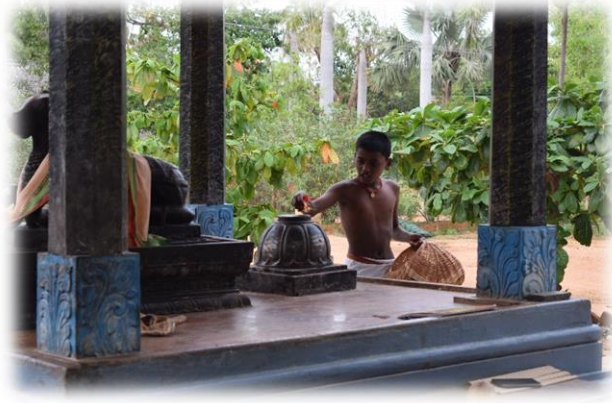
Die alten Blumen einsammeln