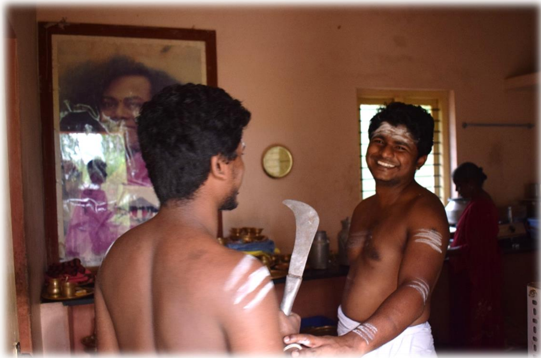
Helfen in der Küche des Tempels