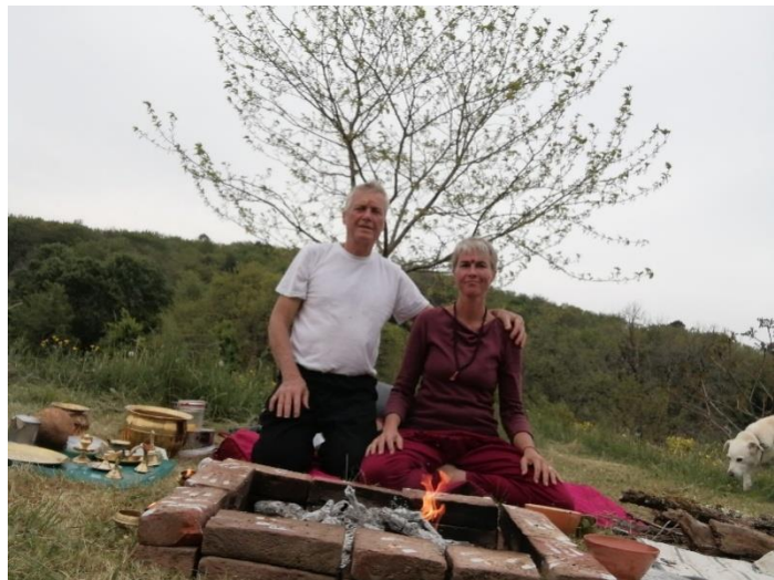
Der göttlichen Mutter gewidmetes Yagam