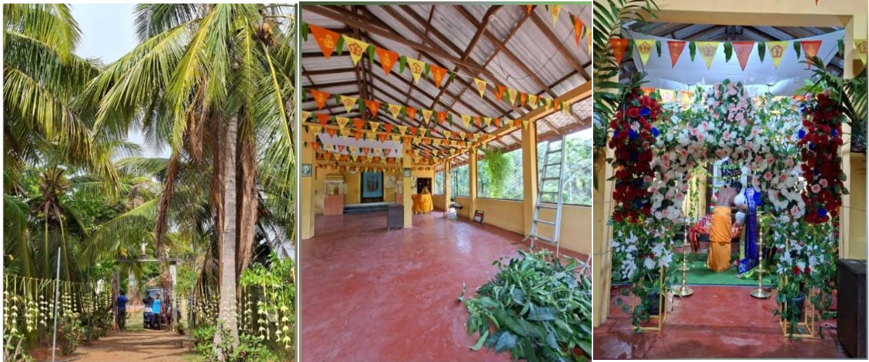
El Ashram Pubala Krishna festivamente decorado para las celebraciones de Krishna Yaianti.