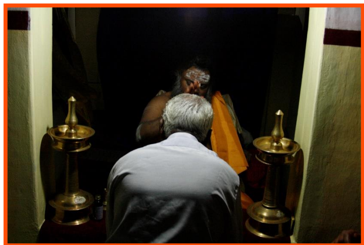
Swamiji in de interviewruimte

Dit raam gaf uitzicht op een kleine kamer waar Swami in een fauteuil zat, recht tegenover de opening, gescheiden door een laag muurtje van ongeveer anderhalve meter hoog van de persoon die hem alleen wilde spreken.