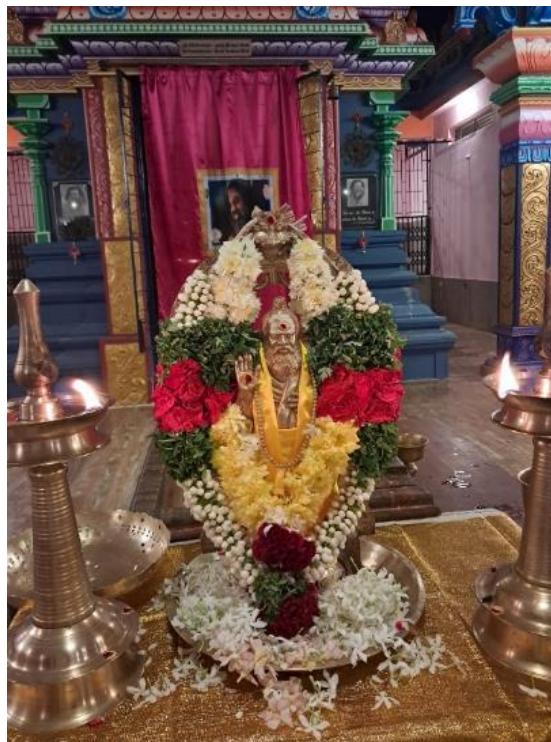
La estatua de Swamiyi después del abhishekam.