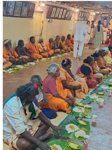
Sirviendo el almuerzo a los sadhus en el Puya Hall;