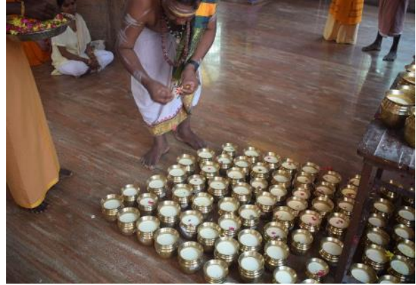
Procesión con ollas de leche; Puya realizada a la leche antes de ofrecerla