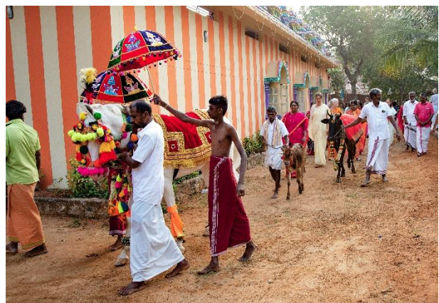
Puya de la vaca y procesión