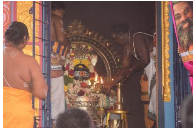
Abhishekam de leche al lingam del samadhi de Swamiyi; lingam del samadhi de Swamiyi después del abhishekam.

Ese día, los sadhus visitaron el Ashram y recibieron una cálida bienvenida. Después de desayunar, organizamos una consulta médica gratuita con médicos y enfermeras, y medicamentos gratuitos.